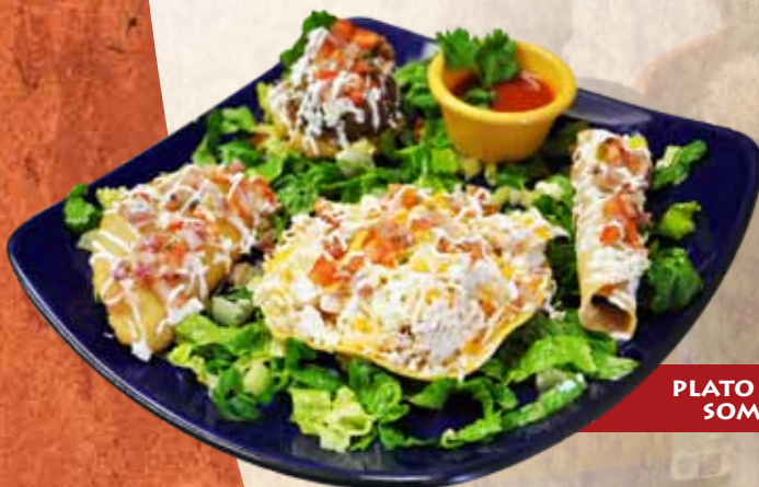
PLATO SEÑOR SOMBRERO

Une quesadilla, une tostada, un taco dorado, un sope et salsa.