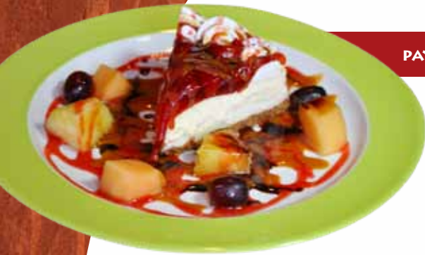
PAY DE LA CALLE