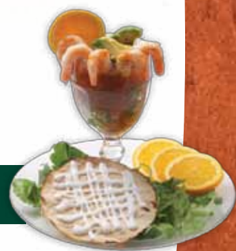
CÓCTEL DE CAMARONES