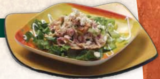
TOSTADA DE POLLO